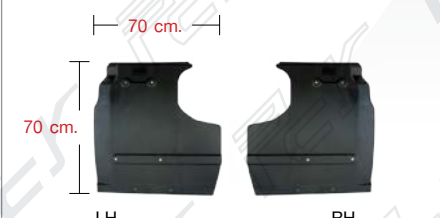
SPLASH BOARD REAR LH/RH PLASTIC (BIG) พลาสติกบังฝุ่นหลัง ซ้าย/ขวา (แบบใหญ่)