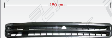
GRILLE ซี่หน้ากระຈัง