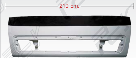
FRONT PANEL แผงหน้ากระຈัง (1 ช่อง)