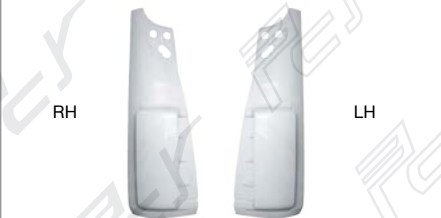
CORNER PANEL LH/RH (CURVE) แก้มไฟหรี ซ้าย/ขวา (แบบนูน)