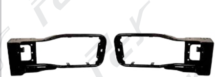
HEAD LAMP STAY ขาจับไฟหน้า