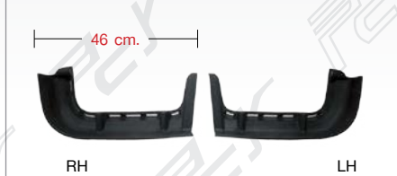
STEP PANEL LOWER LH/RH (BIG) พลาสติกบันไดล่าง ซ้าย/ขวา (แบบใหญ่)