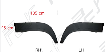
FENDER LH/RH PLASTIC (BIG) พลาสติกบังโคลนข้าง ซ้าย/ขวา (แบบใหญ่)